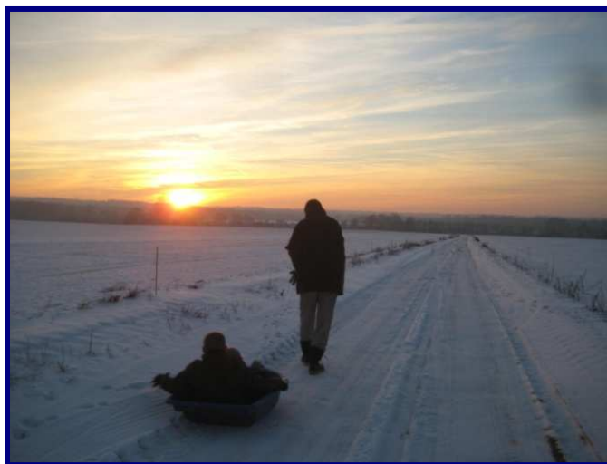
NEIGE SUR LES CHEMINS DE MONTLOGNON