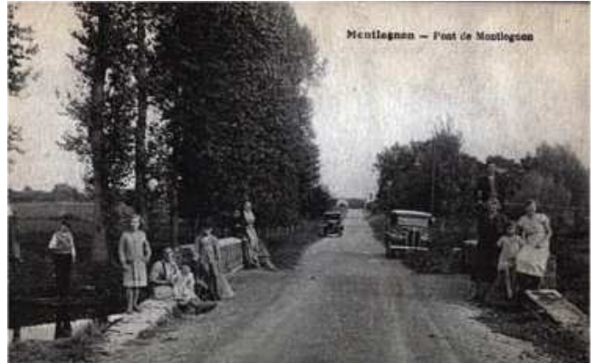
Montlognon vers 1940

En 1939, le château a été réquisitionné par les réfugiés Français et la bâtisse a subi du pillage "utilitaire". Après le débarquement de Normandie le château fut occupé par des aviateurs Allemands jusqu'en août 1944. La famille d'Harcourt, propriétaire à l'époque, put garder quelques pièces pour y vivre et la cohabitation fut parait-il correcte!