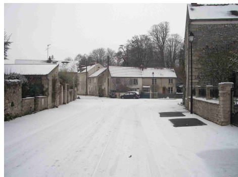
Montlognon sous la neige